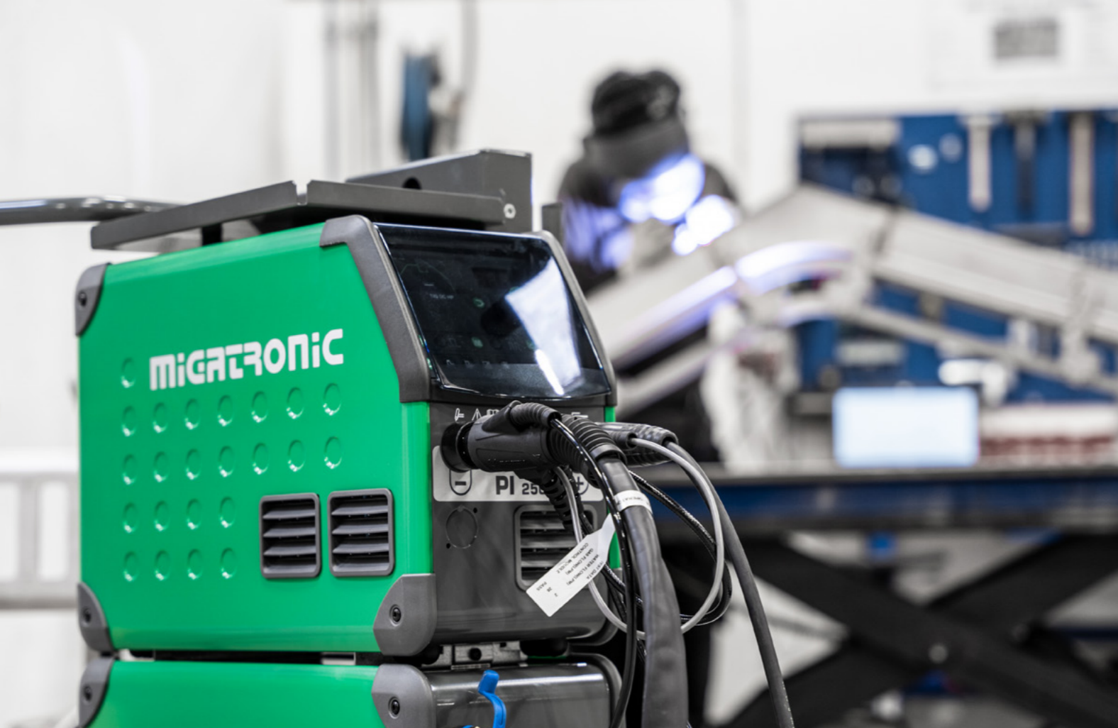
Pi 250 A