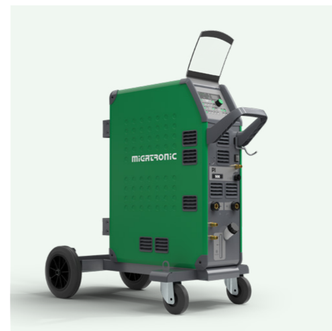
Pi 350-500 A