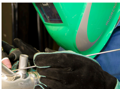
Focus Tig 200 AC/DC PFC svetsar i alla material inkl. aluminium

Focus TIG 200 AC/DC levereras med MIGA Super Blue wolframelektrod, som har utmärkta tändnings- och återtändningsegenskaper och kan användas till alla materialtyper.