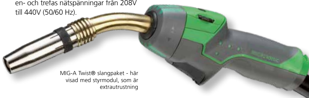
MIG-A Twist® slangpaket - här visad med styrmodul, som är extrautrustning

MIG-A Twist® kan fås i olika längder och med olika svanhalsar och kan konfigureras med olika styrmoduler för reglering av svetsström på brännarhandtaget. Styrmodulen kan lätt bytas efter behov - utan användning av verktyg.