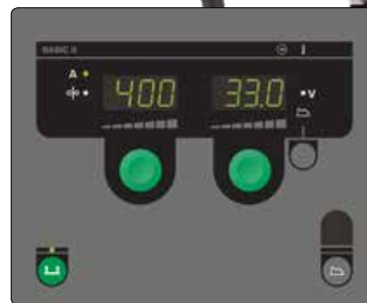
Basic panel til manuel indstilling af svejseopgaver

Omega har indbygget køling, der effektivt holder en lav driftstemperatur i brænderen uanset belastning. Det sikrer lang standtid på sliddele og problemfri trådfremføring. Omega 550S leveres standard med dobbeltkøling, og hvis man vælger Migatronics MIG-A Twist brænder af FKS-typen med dobbelt kølekammer, er man sikret maksimal komfort under alle forhold.