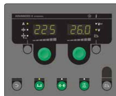
Advanced panel med bl.a. Power Arc og DUO Plus. DUO Plusfunktion, som giver TIG-lignende svejse søm og øget kontrol over smelte-badet. Advanced panelet indeholder synergiske programmer til MIG lodning og svejsning med rør- eller massivtråd i sort og rustfast stål og aluminium.