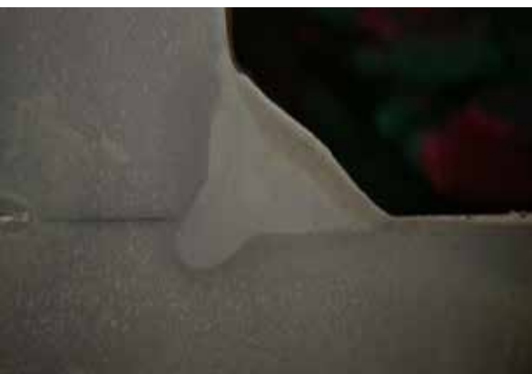
PowerArc sikrer dyb indtrængning ved kant- og stump sømme og øget svejsehastighed i sort og rustfrit stål.