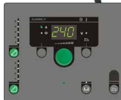
Classic panel til manuel betjening af svejsemaskinen - med den trinløse inverters fordele