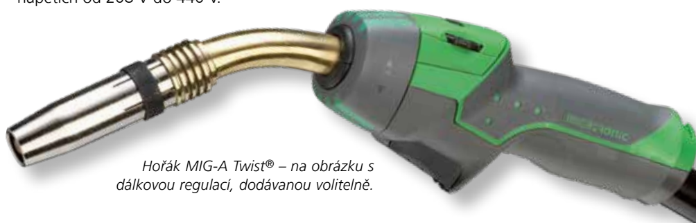
Hořák MIG-A Twist® – na obrázku s dálkovou regulací, dodávanou volitelně.

MIG-A Twist® se dodává v různých délkách a s různými krky. Lze jej konfigurovat s různými dálkovými regulacemi pro nastavení svařovacího proudu z rukojeti hořáku. Dálkové regulace lze snadno vyměňovat podle potřeby bez použití nástrojů.