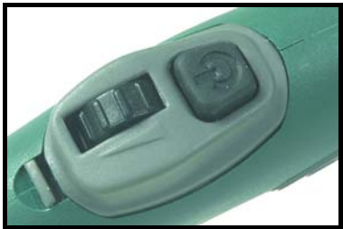
Enkelt tast med TIG reguleringsknop. Anvendes kun på Migatronics maskiner.