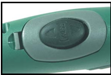
Enkelt tast Keypad unit

As standard the control unit consists of a keypad unit but for use on Migatronic TIG machines, we recommend a control unit with both keypad unit and control knob.