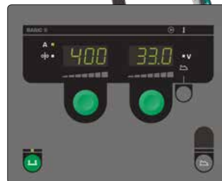
Panel sterowania Basic do ręcznego ustawiania parametrów spawania.

PowerArc™ zapewnia pełny przetop przy spawaniu pachwinowym i doczołowym oraz większą prędkość spawania dla stali miękkich i nierdzewnych.