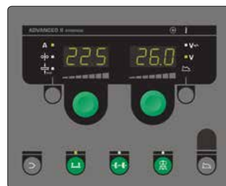
Panel sterowania Advanced wyposażony m.in. w funkcję PowerArc™ i DUO Plus™. Funkcja DUO Plus™ zapewnia wykonanie spawu wyglądem podobnego do TIG i lepsze sterowanie jeziorkiem spawalniczym. Panel sterowania zawiera programy do lutowania twardego MIG i spawania z użyciem drutu z rdzeniem topnikowym lub drutem pełnym do stali miękkich i nierdzewnych oraz aluminium