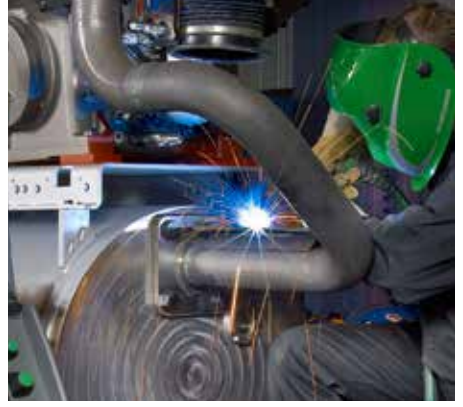
Spawanie stali miękkiej.