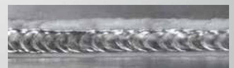
DUO Plus™ - Aluminio

Esta función mejora el control del baño de soldadura y reduce la entrada de calor.