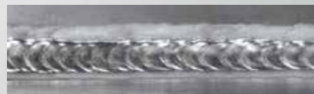
DUO Plus™ - Alumínium

A funkció javítja a hegesztési fürdő szabályozását, és csökkenti a hőbevitelt.