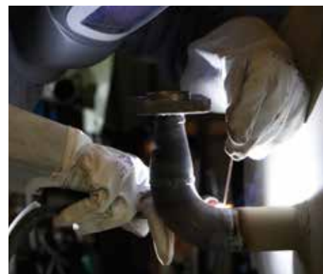
De Focus TIG 200 DC HP PFC last koolstofstaal, roestvast staal en andere DC-lasbare materialen