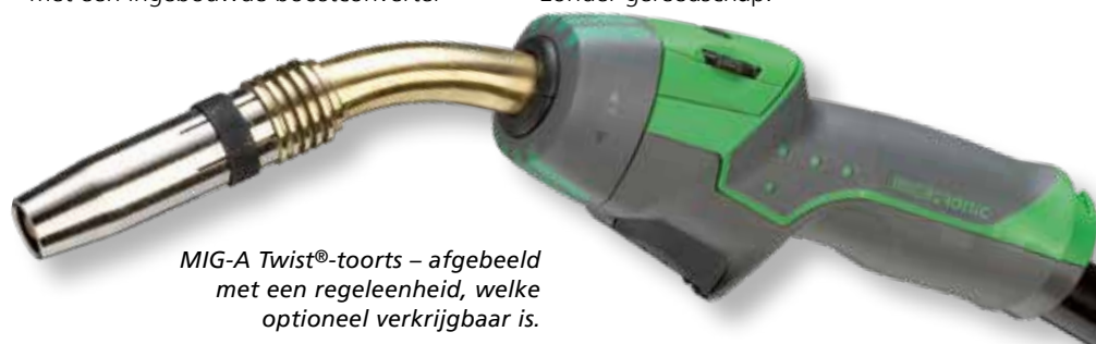
MIG-A Twist®-toorts – afgebeeld met een regeleenheid, welke optioneel verkrijgbaar is.

MIG-A Twist® is verkrijgbaar in verschillende lengtes en met verschillende zwanenhalzen. De toorts is configureerbaar met verschillende regeleenheden voor het aanpassen van de lasstroom op de toortsgreep. De regeleenheid is eenvoudig te verwisselen naar behoefte, zonder gereedschap.