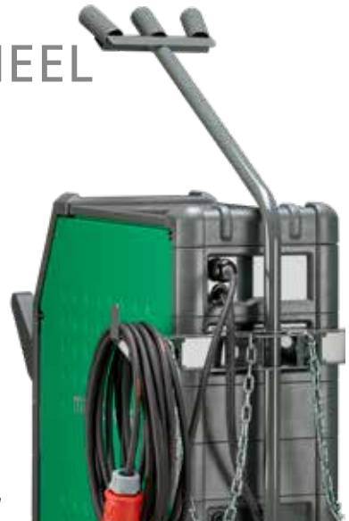
Inrichting voor eenvoudig opwinden van lange kabels.

Toortshouder. Gemonteerd als standaarduitrusting, zoals afgebeeld. Optioneel verkrijgbaar voor montage aan de linkerzijde van het lasapparaat (artikelnummer 78861557)