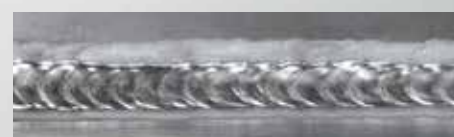
DUO Plus™ - Alluminio

Questa funzione migliora il controllo del bagno di saldatura e riduce l'apporto di calore