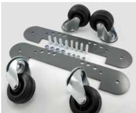
Set di ruote per montaggio sotto il telaio di protezione (articolo n. 78861413)