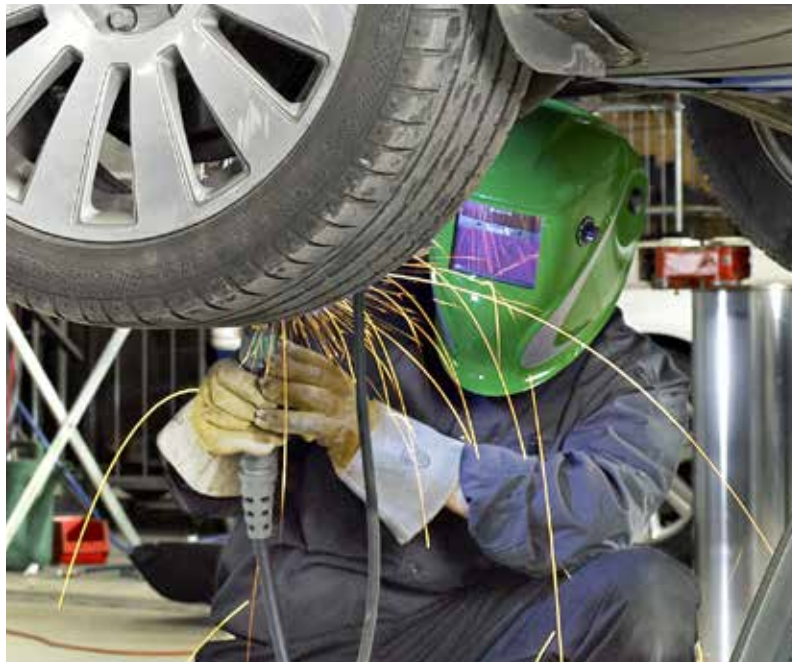
MJCT™ ermöglicht, bis zu 200 individuelle Schweißabläufe abzuspeichern.

Intelligent Gas Control IGC® heißt eine optionale Ausstattungsvariante der Flex 3000-Geräte: eine dynamische Gaskontrolle, das den Gasschutz überwacht und optimiert. IGC® führt zu Gaseinsparungen von bis zu 50%. Die Pluspunkte: Sie gewinnen Zeit (und natürlich Geld!), weil Sie weniger oft die Gasflasche austauschen müssen und schonen dabei noch die Umweltressourcen. Besonders interessant für die Automobilbranche, die typischerweise kurze Schweißnähte und Punkt-