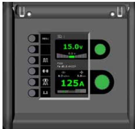
Flex 3000 Steuereinheit