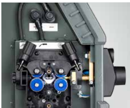
LED ljus i matarverket (artikelnummer 78861545)